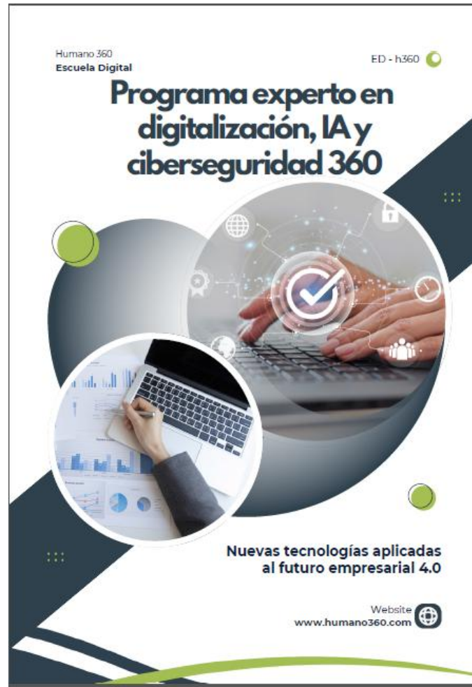
Imagen del producto/servicio a promocionar